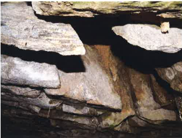
Výrazná porucha v poli 2. Vypadlé kameny z nosné konstrukce na levé straně cca 80 cm od levého kraje.