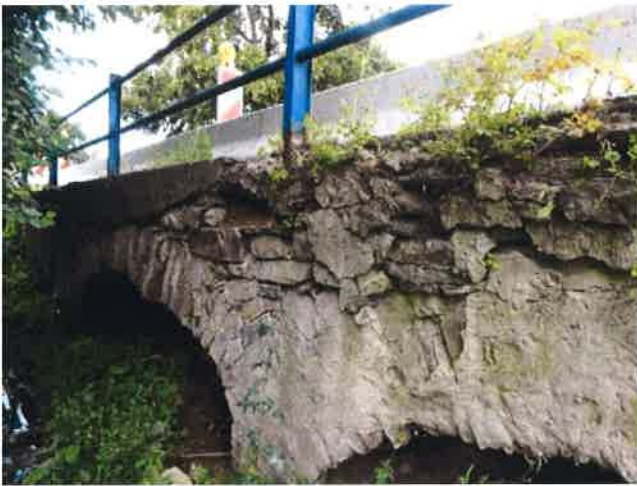
Rozpad levé čelní zídky nad středním pilířem P2. Vypadlé kameny.