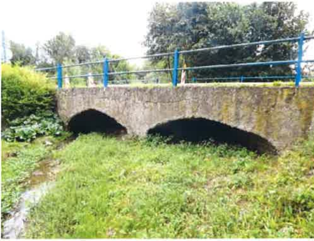
Pohled na pravý bok mostu.