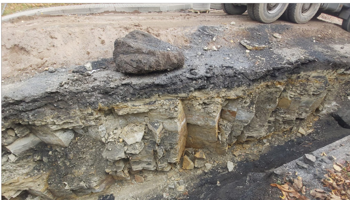
Obr. 5 Skalní masív navětralých slínovců s těžitelností 5. třídy (ČSN 73 3055) vychází místy prakticky až k povrchu terénu (1,850 km).