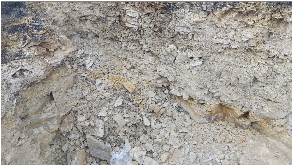
Obr. 4 Polohy tvrdých spongilitických slínovců (světle šedé) s těžitelností 6. třídy (ČSN 73 3055) v hlubší úrovni stavební rýhy (1,800 km).