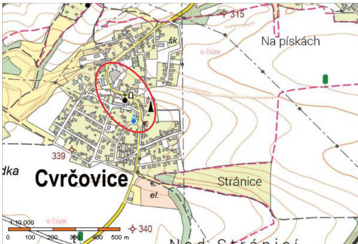
Obr. 1 Situace stavby v mapě 1 : 10 000 (podle ČÚZK).