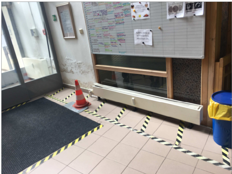
výměna radiátoru út