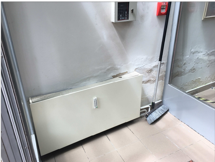
fotodokumentace proskleného zádveří včetně radiátorů ÚT