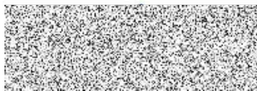
Martin Plešivka PLYN – VODA - TOPENÍ Dodavatel