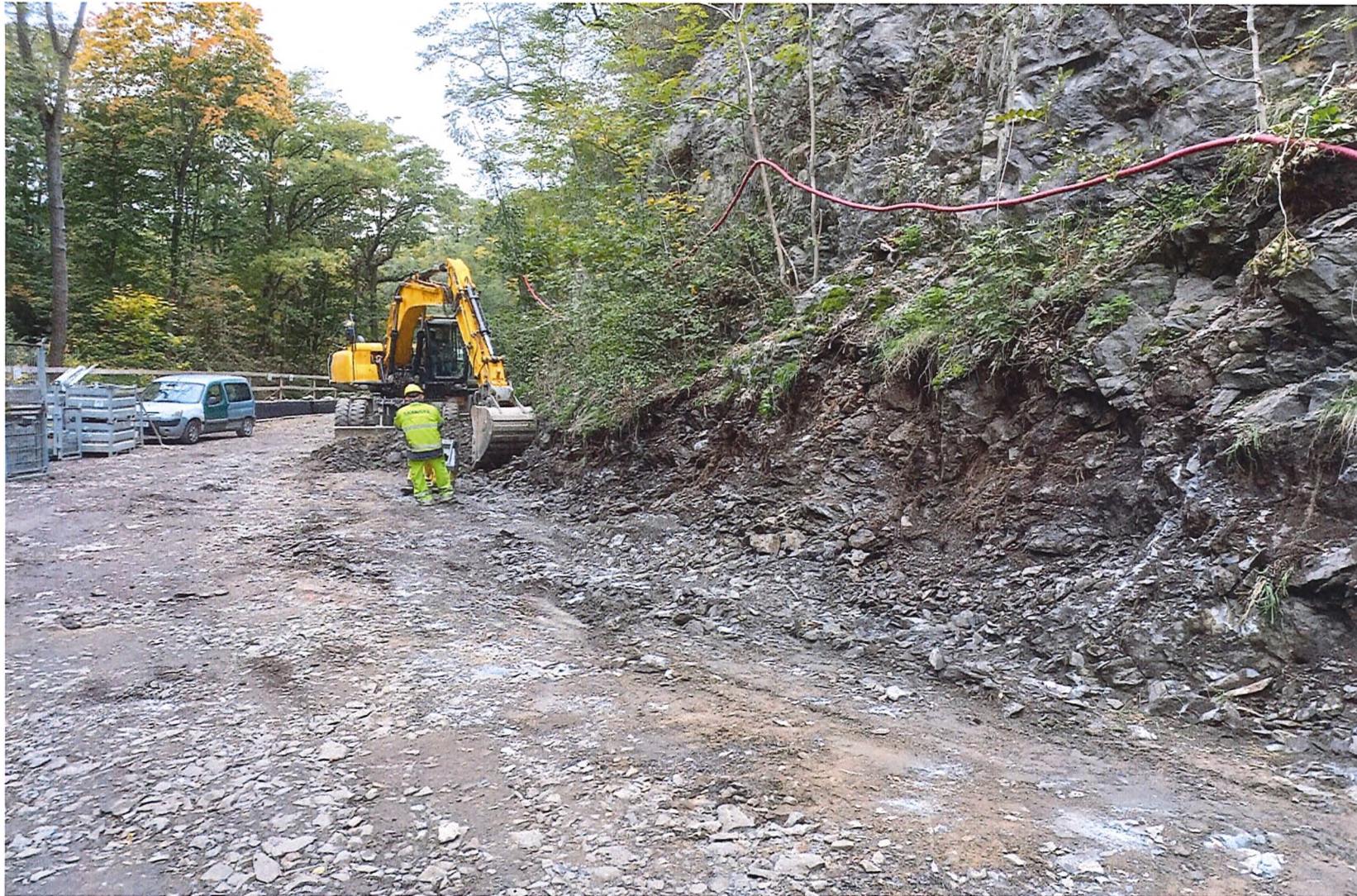
Výkop pro obrubníky – skalnaté podloží