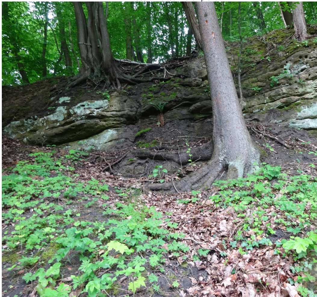
Obrázek 3 - Stromy hrozící vývratem