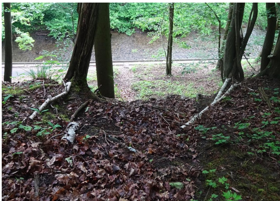
Obrázek 2 - Erozní rýha