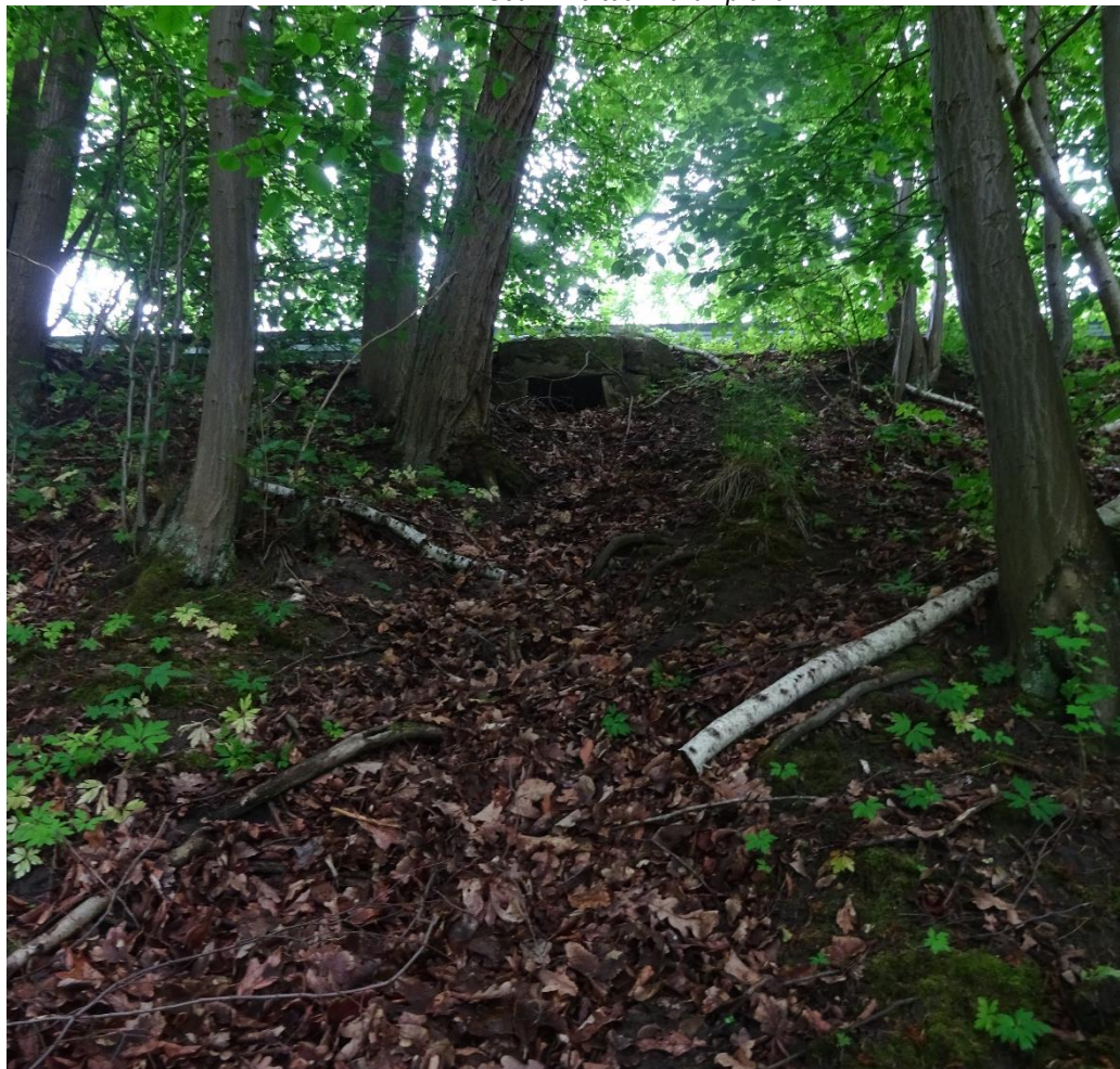
Obrázek 1 - Propustek v horní části svahu pod III/2771