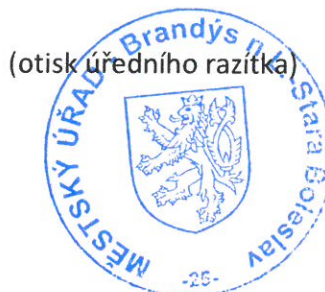
Roman Bárta referent silniční hospodářství

Středočeský kraj, Zborovská 11, 150 21 Praha 5, v zastoupení na základě plné moci firmou Česká stavební aliance s.r.o., Zelený pruh 95/97, 140 00 Praha 4 Obec Líbeznice, Mělnická 43, 250 65 Líbeznice Pražská plynárenská distribuce, a.s., U Plynárny 500, 145 08 Praha 4 Krajská správa a údržba silnic Středočeského kraje, Zborovská č.p.11, 150 21 Praha 5 ČEZ Distribuce a.s., Teplická 874/8, 405 02 Děčín IV-Podmokly CETIN a.s., Olšanská 2681/6, 130 00 Praha 3 Patrik Hutník, Antonína Judytky 866, 250 65 Líbeznice Leoš Petříček, Frýdlantská 1319/5, 182 00 Praha Kobylisy Vratislav Srb, Hovorčovická 388, 250 65 Líbeznice