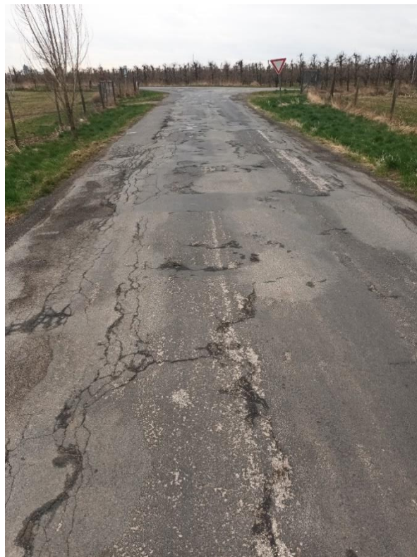
úsek 2 – silnice III/24015